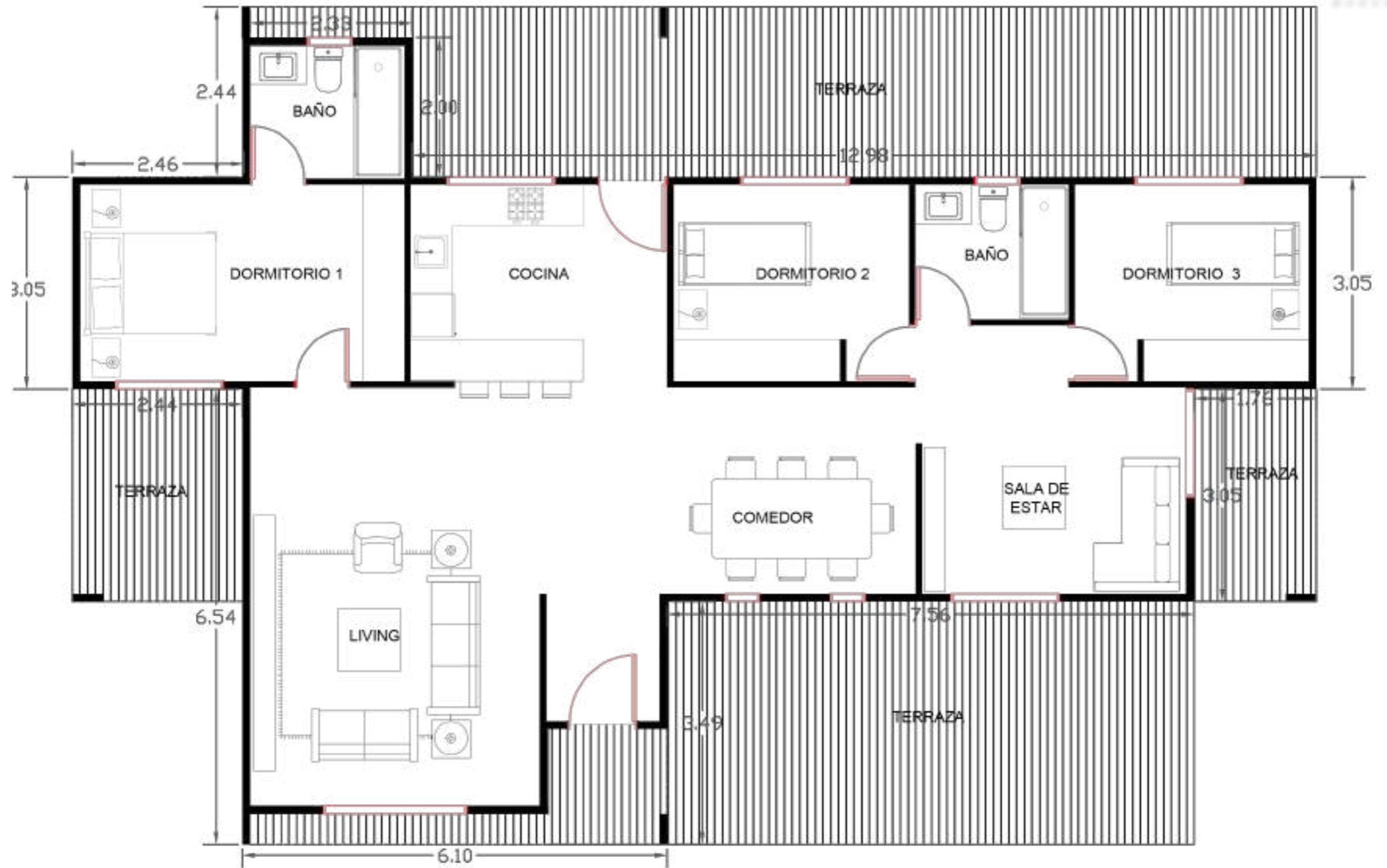
PLANO DE PLANTA